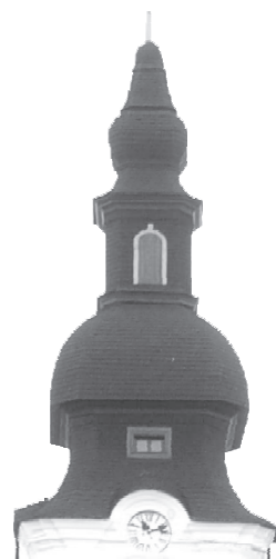
Reményik Sándor: Templomok

Én csak kis fatornyú templom vagyok, Nem csúcsíves dóm, égbeszökkenő, A szellemóriások fénye rámmagyog, De szikra szunnyad bennem is: Erő.