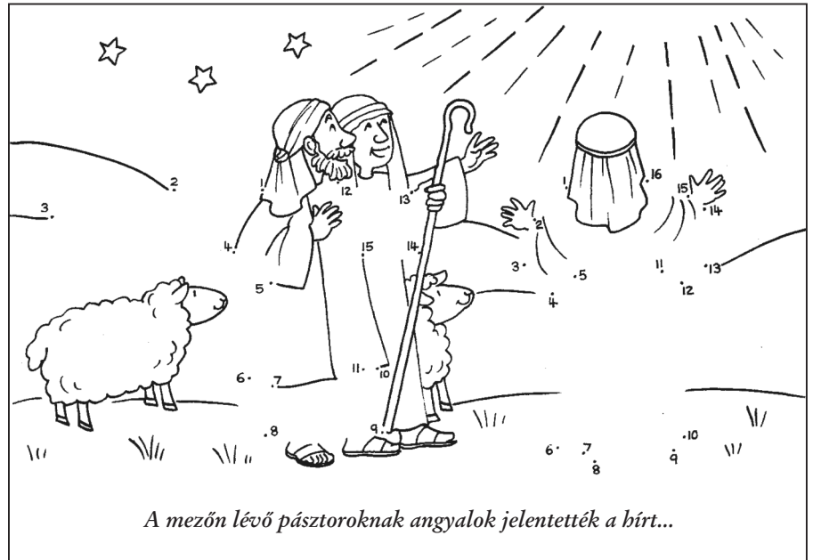
A mezőn lévő pásztoroknak angyalok jelentették a birt...